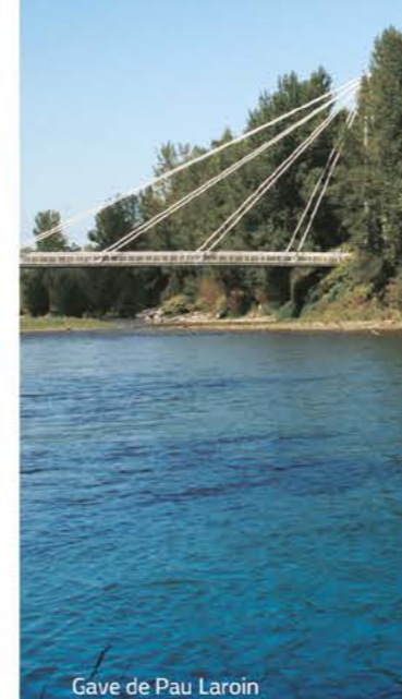
Gave de Pau Laroin

Cette logique de gestion par bassin versant amène la plupart des EPCI-FP membres du Syndicat à adhérer également à d'autres structures de gestion des cours d'eau. C'est le cas au Nord sur les bassins des Luys et de l'Adour ou au Sud sur le bassin du gave d'Oloron.