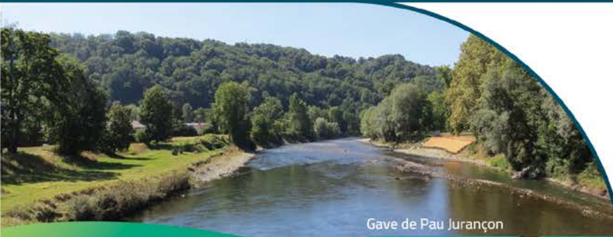
Gave de Pau Jurançon

Communauté de communes du Pays de Nay Communauté d'agglomération Tarbes Lourdes Pyrénées Communauté de communes Nord-Est Béarn Communauté d'agglomération Pau Béarn Pyrénées Communauté de communes du Haut Béarn Communauté de communes Lacq-Orthez Communauté de communes du Béarn des Gaves Communauté de communes du Pays d'Orthe et Arrigans