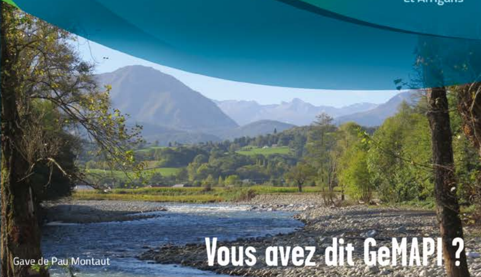
Gave de Pau Montaut