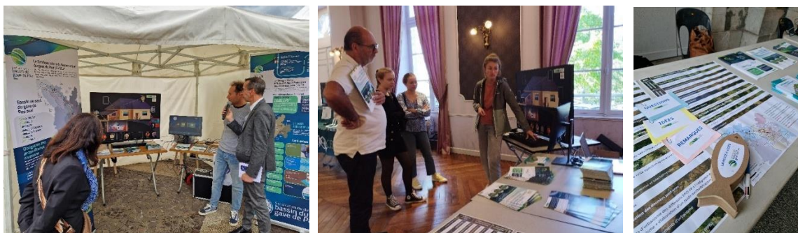
Figure 3: Stands de sensibilisation PAPI grand public