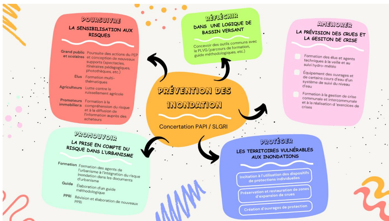
Figure 1 : principaux résultats de la concertation (ateliers de travail)

Les principaux éléments abordés lors de ces ateliers sont représentés schématiquement dans la figure qui suit :