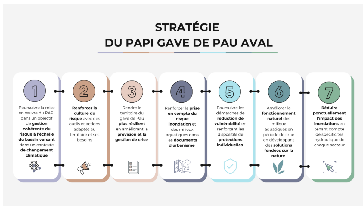
Figure 5 : Stratégie du PAPI du gave de Pau

La stratégie du PAPI du gave de Pau aval est décomposée en 7 Orientations Stratégiques. Pour chacune d'entre-elles, il est précisé le Grand Objectif (GO) du PGRI auquel elle fait référence.